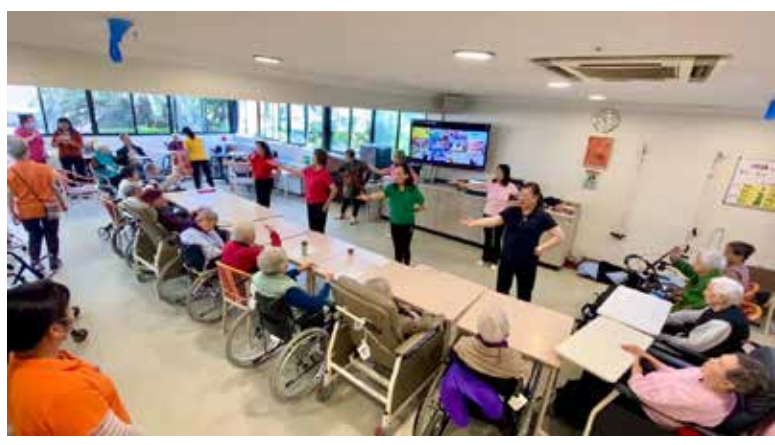
百思道樂齡讚美操小組

我再跟負責人溝通過，他提到花園離電源插座很遠，唯一靠近花園的門也壞了，無法使用插頭。我本來想着可以自己帶長電線，或自備音響、麥克風和電腦，提前在家充好電，但最大問題是現場沒有電視，老人家只能聽我們唱，無法看到歌詞，