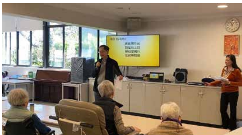
周牧師講中秋節信息

感謝主，23日早晨，院方再次來電，告知裝修工人改為晚上施工，活動室可照常使用！而且場地提供電視、藍牙音箱與無線麥克風，電視甚至可透過 HDMI 線連接電腦。哈利路亞讚美主，真是奇妙的恩典！