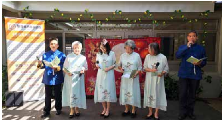
粵韻雅聚粵曲獻唱

2025 年 9 月 24 日，角聲愛鄰社與天恩華人長老會 Bonnyrigg 分堂的兩個福音團隊——「粵韻雅聚」及「陽光舞者」，一同前往