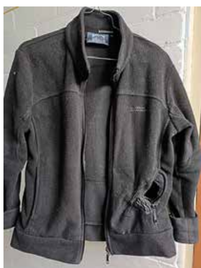
外衣口袋處破損，身體卻沒有受傷

幸好氣囊沒有彈在我們臉上，否則臉部和眼睛必然受傷；在眼科門診部工作時，曾有被氣囊擊中雙眼，來複診的病人。後來又發現外衣左邊的衣袋口，因嚴重摩擦，被燒灼致變形，其下的衣服亦有一些損破。假如意外發生在夏天，衣服單薄，那麼，左腹便會嚴重灼傷。