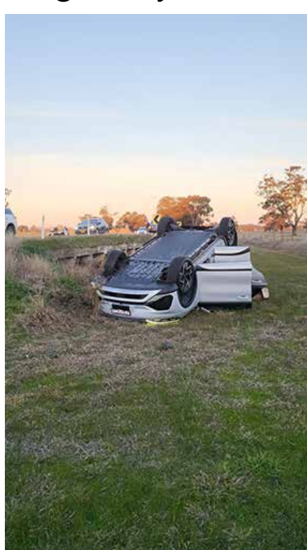
汽車翻下路面，四輪朝天

漸漸夕陽西斜，已駛在 Stuart High Way，但斜陽灑在路上，很是耀眼，雖有太陽眼鏡也很難看清楚路面，只好小心翼翼地沿路駛去，導航儀表示還有 20 多公里便可抵達。忽然砰然巨響，車子向左方滾下，原來汽車翻了，驚呼過後，彼此確認沒有受傷；此時我倆東倒西歪，丈夫斜壓在我雙膝上，氣囊已張開，彈在他肩膀上；玻璃窗已碎，連忙解開安全帶，打開車門爬出去。汽車四輪朝天。丈夫忙致電女兒。我們都行動自如，我則左肋有點痛，坐在草坡上休息，有多輛路過的車停下，還有一些人圍觀，並且協助我們。