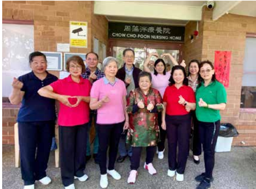
周藻泮養老院門口合影