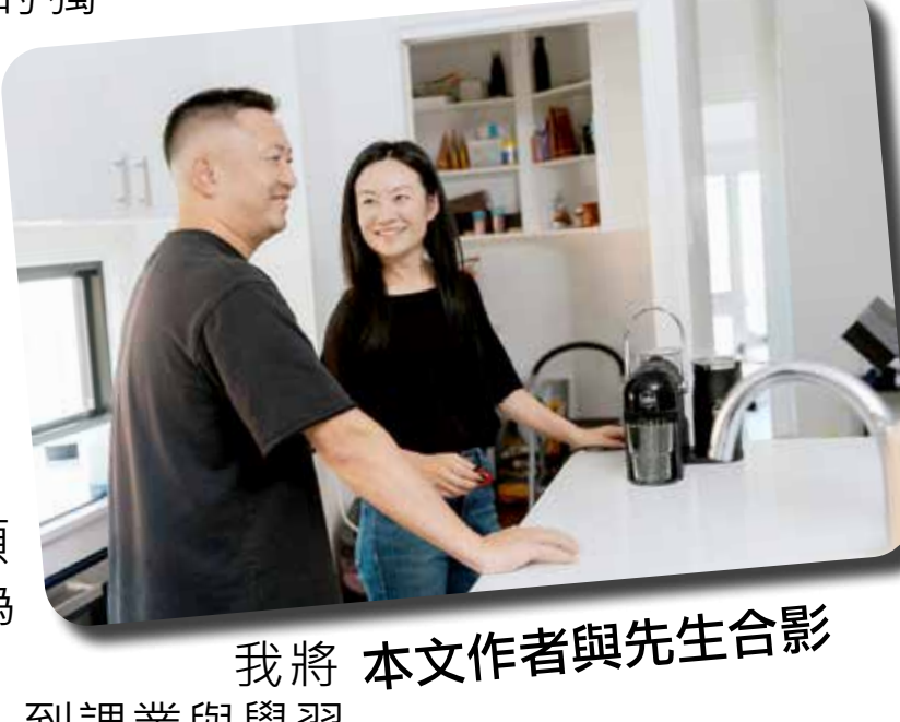
我將 本文作者與先生合影

我是家中的獨生女。從小我就習慣把自己封閉起來，因為家裡經常吵架，這讓我感到害怕，也感到羞恥，所以我不願對人提起。為了逃避現實，全部心思投入到課業與學習中。