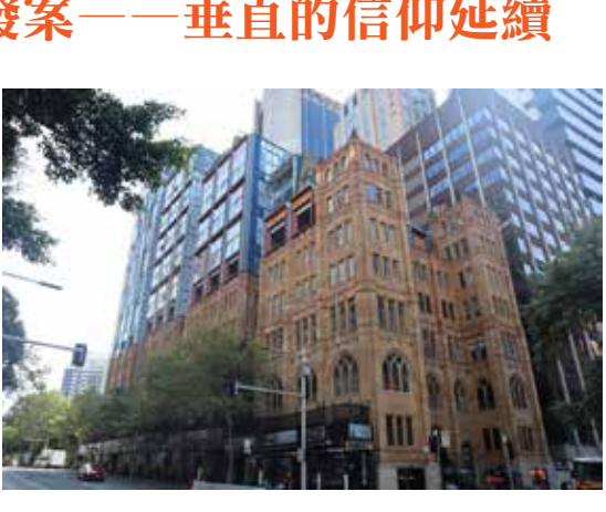
蘇格蘭長老會教堂

轉角來到約克街 2–4 號，矗立於此的「蘇格蘭長老會教堂」，為澳洲首座長老宗教堂，始建於 1882 年，並於 1929 年翻修。今日，它仍保留哥德復興式立面的莊嚴輪廓，而其上新建的 12 層現代住宅塔樓，則巧妙融合了信仰空間與都市居住的功能，共容納 148 個公寓單位。