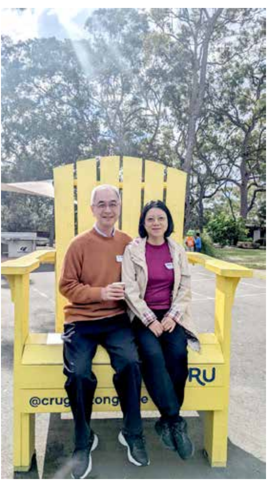
作者與先生在教會退修營

時隔多年，當我信主以後，想起那個姊妹的選擇，自己就推測，一定是她看到了什麼，我還沒有看到的東西，那一定是更有價值的東西，是值得她放棄一切去追求的，不然她怎麼會做出那樣的選擇呢？還有很多和她一樣的人，他們不是沒有文化，沒有受過教育，他們不是沒有頭腦的人，不是輕易會被忽悠的人。