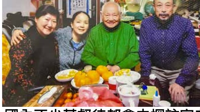
國內不少基督徒都會去探訪安老

安寧也在很小的年紀，便從苗族奴隸那裡聽到讚美詩，知道他們是在敬拜上帝，但他並沒有從家裡的奴隸那裡認識主耶穌，他認識主是在北大讀書期間。當時北大有很多師生，在王明道的史家胡同「北京基督徒會堂」聚會，安寧也是其中一員。