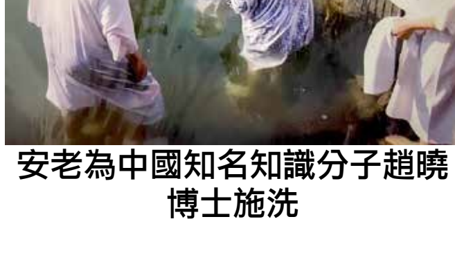
安老為中國知名知識分子趙曉博士施洗

安老名叫安寧，出生在土司家庭，是名副其實「含着金湯匙出生」的早年「土司」那種人。在邊鄙貧困的貴州，土司制實後代時期的質是一種土流並治的制度；流官只管城安寧鎮，其它地方全部都歸原有的彝族地主自管；這些彝族地主小的稱為土目，大的稱為土司，他們不但是地主和奴隸主，名義上還是朝廷的命官，擁有司法、軍隊、行政的世襲權力，可謂是權傾一時，獨霸一方。