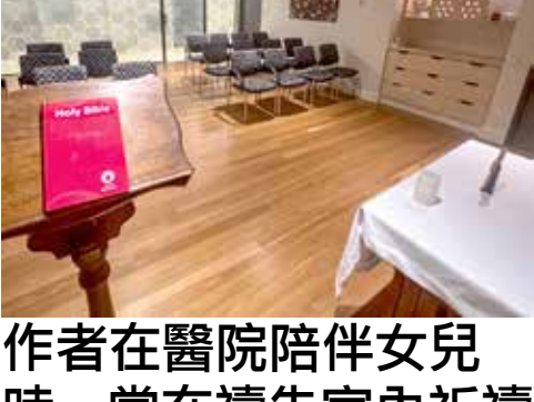
作者在醫院陪伴女兒時，常在禱告室內祈禱

「不要怕」是重點，當時的情景是「忽然狂風大作，海就翻騰起來。」(《約翰福音》六章18節)，這很符合我當時的心情，我確實有被「海浪翻騰」衝擊得頭暈目眩的感覺。我知道，這是我人生當中，遇到的最大風暴和最嚴峻考驗。但是，當我聽到耶穌的這句話，福音書的這一段信息之後，我的心便大得安慰，我清楚這是神在對我說話，女兒的病是有希望被救治的！