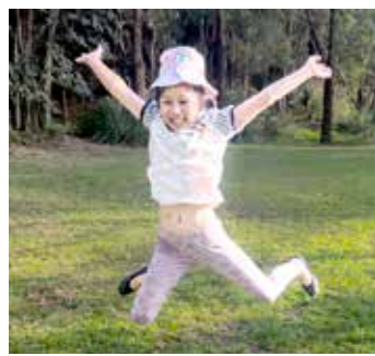
如今美芯已完全康復，歡喜雀躍

我有個習慣，每天都會收聽良友電台《曠野嗎哪》靈修系列的福音信息。每當我遇到艱難困苦的時候，當晚的福音信息裡，總會包含神為我提供解決這些難題的答案。