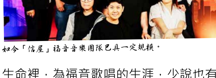
如今「信屋」福音音樂團隊已具有一定規模。

是的，這位網友說得真好！信屋，不但是一間用「信望愛」信仰基礎搭建的團契場所，還是一間用讚美的歌聲做窗戶，讓人能夠看見生命之光、聽到牧羊人召喚的靈魂之家。