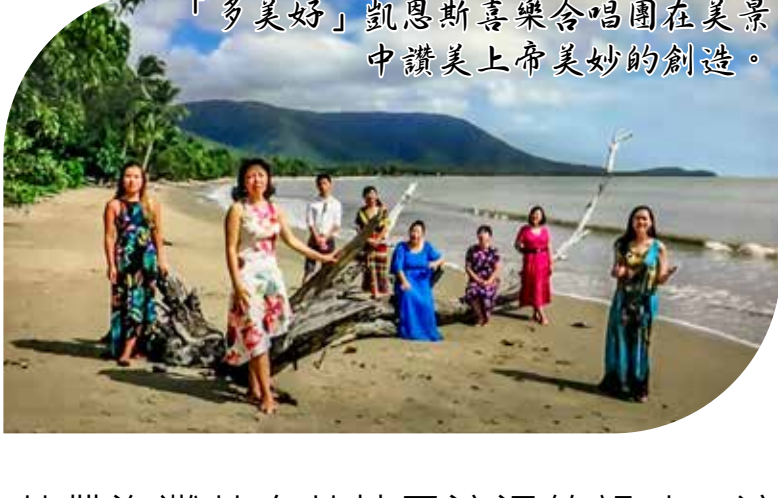
「多美好」凱恩斯喜樂合唱團在美景中讚美上帝美妙的創造。

輕柔的海浪，伴着鋼琴悠揚的節奏；海風吹拂，歌聲從沙灘上飄來；椰林搖曳，彷彿在為歌聲伴舞；而此時遠山青翠，藍天白雲，充滿着熱帶海灘特有熱情又浪漫的韻味。這裡是凱恩斯眾多美麗海灘中的一處，一群臉上綻放着喜樂笑容的姊妹們，正赤足踏浪，悠悠揚揚地走着，她們邊走邊唱：