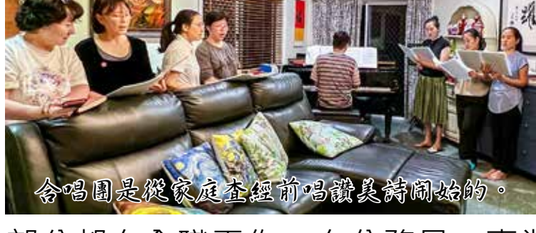
合唱團是從家庭查經前唱讚美詩開始的。

聽，她們的歌聲唱得多麼動人，和聲是那麼和諧；視頻選取的外景，與歌曲演繹風格也是配合得天衣無縫；還有服裝配置是那麼靚麗耀眼，情景演員的表演也恰到好處。