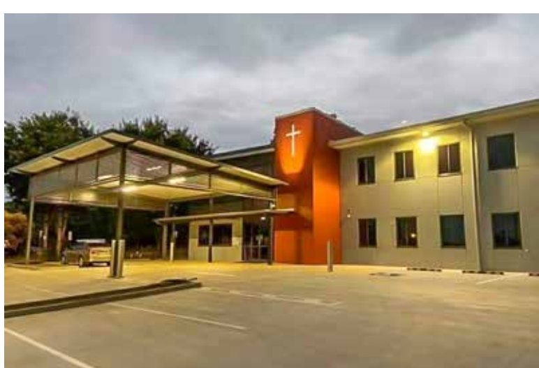
新落成使用的南區國際宣道會外景

座落在布里斯本華人聚居區、新利班主幹道上的「南區國際宣道會」華語堂，三月27日舉辦了隆重的新教堂落成儀式。布里斯本及陽光海岸眾多華人教會的牧師、宣教機構的傳道人，以及本報昆州聯絡主任均到場祝賀。該教會是《號角月報》在昆士蘭州最主要的分派點。