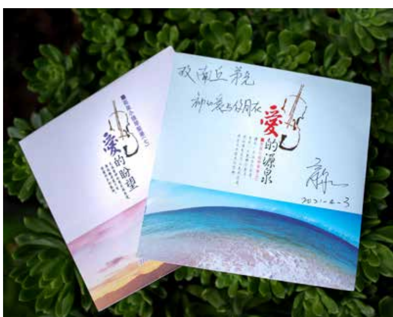
商泉弟兄送給本報昆士蘭版的最新唱碟

商泉弟兄是忠誠又勤奮的小提琴演奏家。疫情前，他非常忙碌，要為福音的傳播，東奔西跑，受邀到世界各地去參與聖樂的服事演出。自從疫情爆發以來，他無法出國演出，甚至跨州的聚會都要被取消；可他心裡牽掛著疫區的災民，身體也沒顧得乘機閒暇下來。