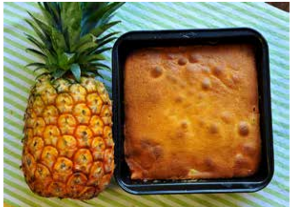
蛋糕出爐時外觀是這樣