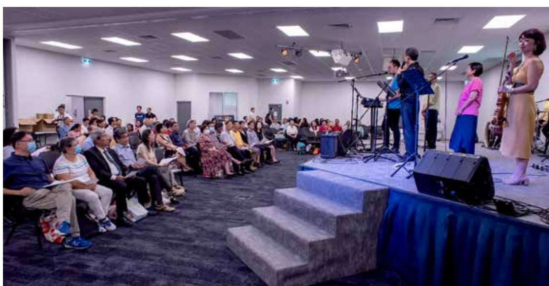
昆州眾多教牧同工出席獻堂禮

新教堂的落成，見證了《聖經》裡上帝的話語所具有的無比大能，《馬太福音》十九章26節經文這樣說道：「在人這是不可能的，在上帝凡事都能。」的確，教堂並不是一座普通的建築物，每座教堂都有其感恩的故事。這座新教堂在建立的整個過程中，彰顯出倚靠上帝的靈能成大事的神蹟，同時也記載了教會全體成員，為響應上帝的呼召而捨己的奉獻精神。