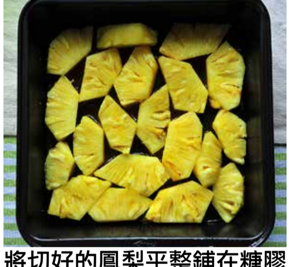
將切好的鳳梨平整鋪在糖膠上