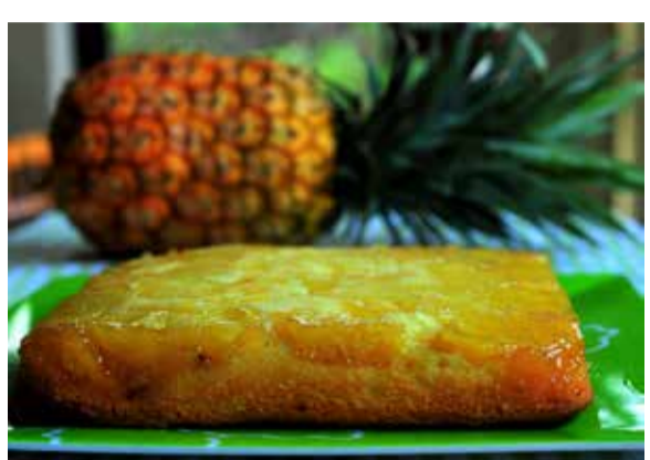
賣相誘人，美味可口的鳳梨蛋糕

由於鳳梨上面抹了糖漿，不僅能使鳳梨保持完整形狀，同時也中和了鳳梨的酸性，製造非常甘香的口感。不過，鳳梨蛋糕儘管誘人，還必須忍耐多30分鐘，要讓蛋糕充分冷卻後才好切開與弟兄姊妹們分享。