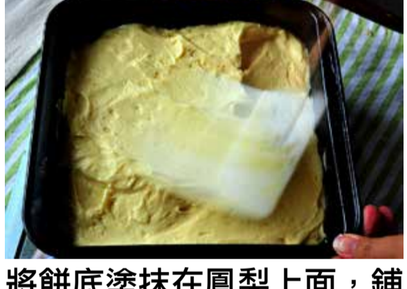
將餅底塗抹在鳳梨上面，鋪勻