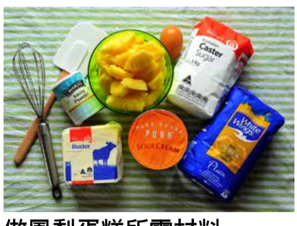
做鳳梨蛋糕所需材料