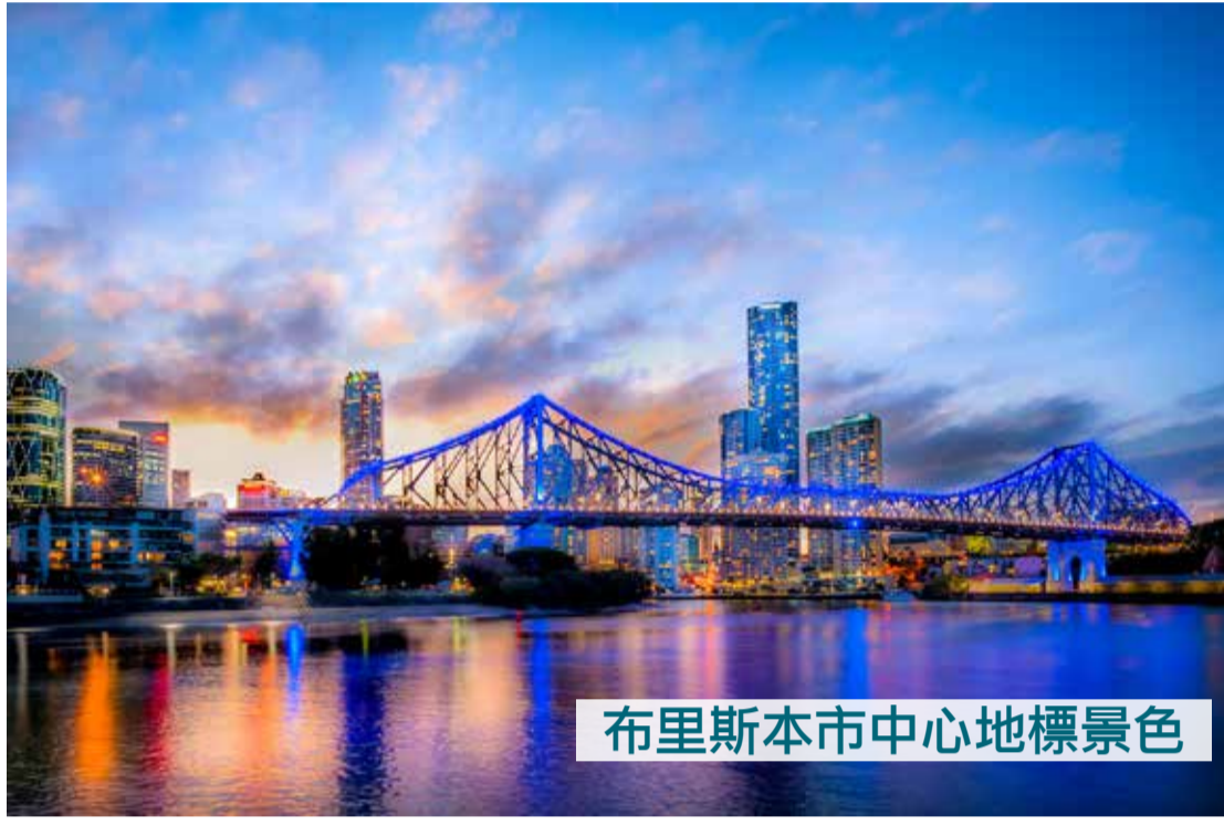
布里斯本市中心地標景色

儘管疫情給整個社會帶來極大的衝擊，對已有的、正常運作的社會模式，造成難以彌補的損害，不過也讓人們嘗試出在家辦公和遙距服務等新型的社會運作模式來。這樣的改變，自然影響到人們對生活環境的不同需求。